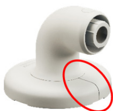
①エンドブラケット