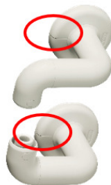
②オフセットブラケット