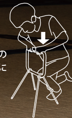
床からの 立ち上がり